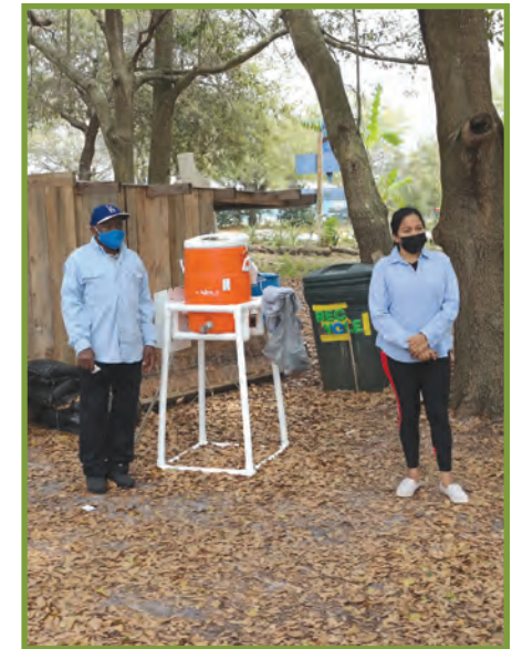
Q'onkja kab' q'ob' kyxola kyuk'il tuk'ila toj aq'until.