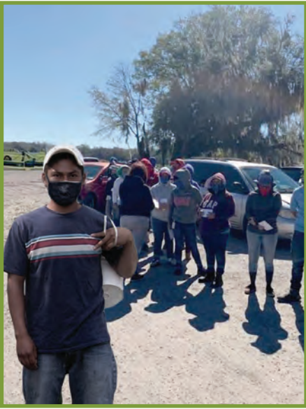
Mixti' tu'n tok laq'eya jatumel at nim xjal.