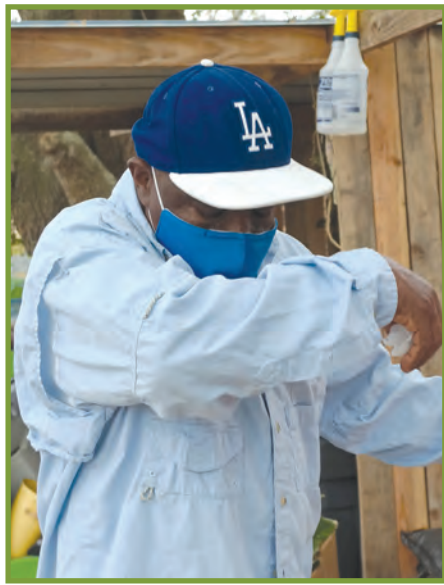
Ky'iñamina ti'j tch'ek tq'ob'a, mya toj tq'ob'a.