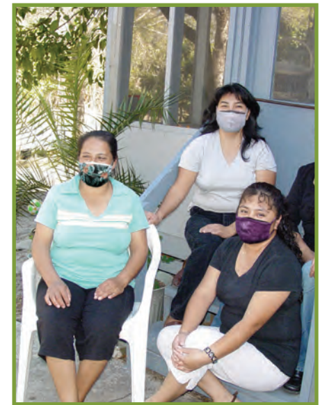
Aj tpona te ula kyuk'il junjuntl xjal, q'onka potzb'il ttziya ex ttxa'na ex kyb'uyinku kyib'e twi'pe'n.