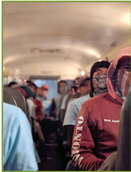
Qo'nka potzb'il tziya ex ttxa'na extzun jaqonkub'a spik'b'il qa in be'ta toj xkotz kyuk'il junjuntl xjal.