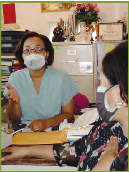
B'a'n tu'n tyolina tuk'il jun ajq'anil qa at t-xejela tib'aj xuyq'anb'il.