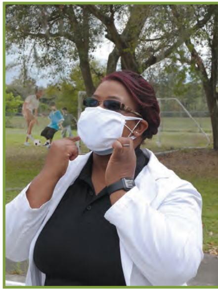
Kukx tu'n tajb'en kab' potzb'il tziya tu'n tmaqet ttxa'na ex tziya kyxol xjal.