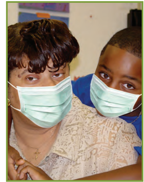
Kukx tu'n tajb'en potzb'il tziya ex ttxa'na tu'n tten tjaxjala ex tkojb'ila toj tb'anil.