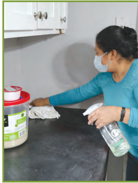
Ñilsama ex tx'ajonkub'a kyaqil q'ij aju tenb'il in ok ttzyu'na atl junjun maj.