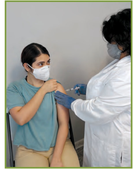
Q'onka xuyq'anb'il ti'ja.