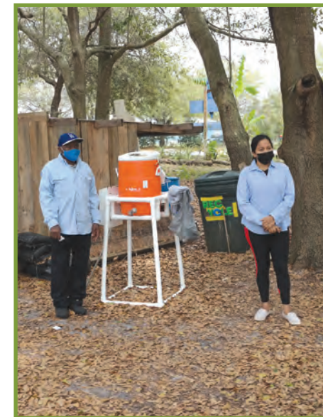
Kenbe 6 pye distans ant ou menm ak kolèg travay ou.