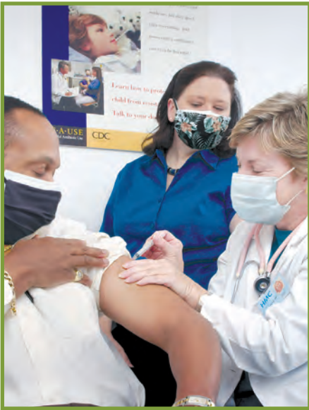
Ale pran vaksen an.