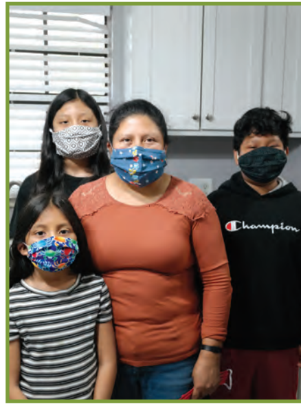
Mete mas la se yon fason pou pwoteje fanmi w ak kominote w. Pa janm bliye mete l.