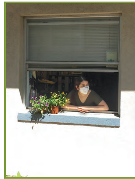
Ouvè fenèt yo lè ou ap resewa moun nan yon espas fèmen oswa andedan lakay w.