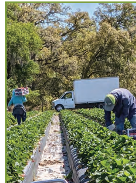
Kenbe 6 pye distans ant ou menm ak kolèg travay ou.