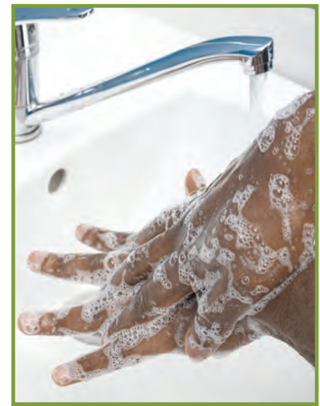
Pa neglige lave men w tanzantan ak savon ak dlo.