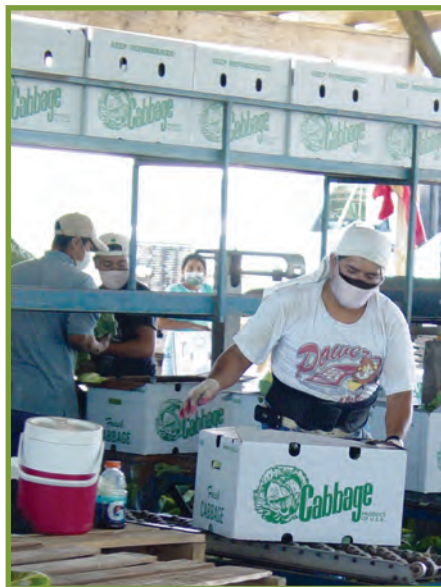
Fòk ou kenbe omwen 6 pye distans ant tèt pa ou ak lòt moun, menm si ou mete mas.