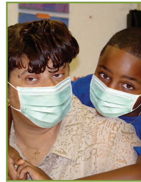
Mete mas la se yon fason pou pwoteje fanmi w ak kominote w. Pa janm bliye mete l.