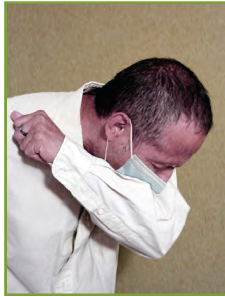
Estènen nan koud ou, pa janm fè sa nan men w.