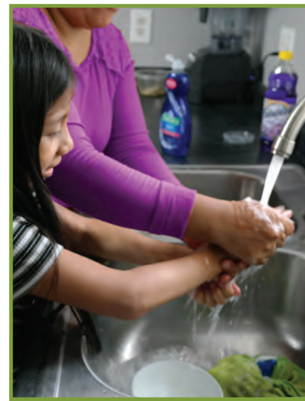
Pa neglige lave men w tanzantan ak savon ak dlo.