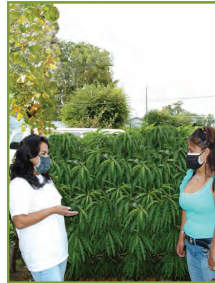
Menm si moun yo santi yo byen, toujou mete mas si ou pataje kay ou ak moun ki pa nan fanmi w oswa ki pa pwòch ou.