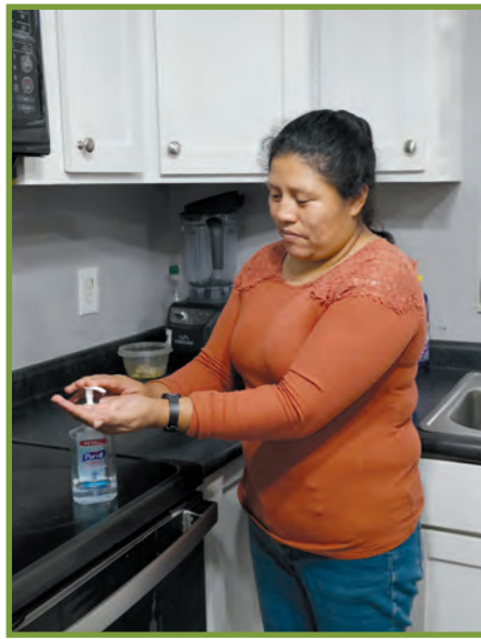
Netwaye men w avèk yon dezenfektan (hand sanitizer) lè savon ak dlo pa disponib.