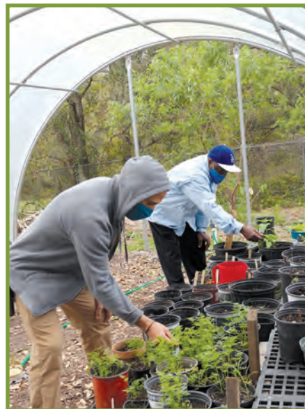
Fòk ou kenbe omwen 6 pye distans ant tèt pa ou ak lòt moun, menm si ou mete mas.