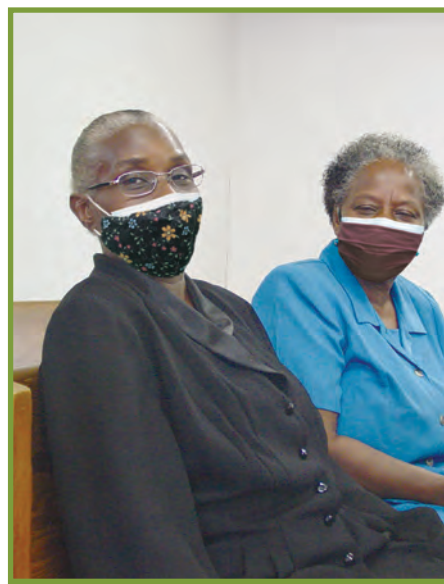
Lè w ap vizite lòt moun oswa lè w ale legliz, toujou mete mas epi chita sèlman bò kote moun ou ap viv avèk yo.