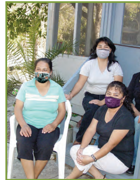
Lè w ap vizite lòt moun, toujou mete mas epi rete chita deyo.