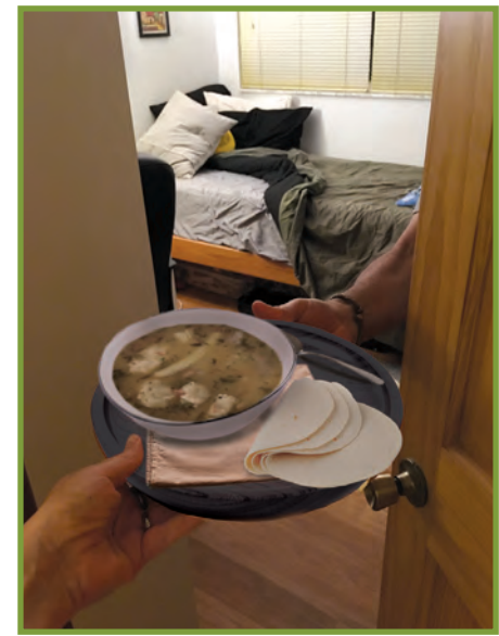
Si w malad, dòmi nan yon chanm apa, menm lè w ap manje.