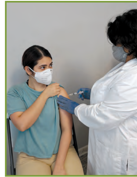
Ale pran vaksen an.