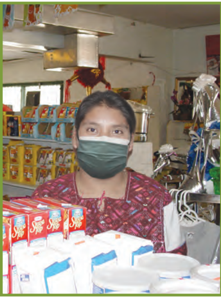
Toujou sonje mete de mas nan figi nou: youn pou kouvri bouch nou, lòt la pou kouvri nen nou lè nou nan lari.