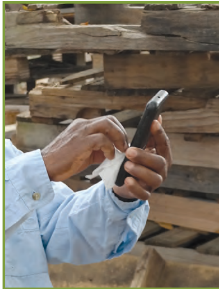
Netwaye telefòn ou ak kle ou chak jou.