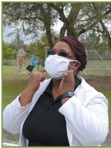
Toujou sonje mete de mas nan figi nou: youn pou kouvri bouch nou, lòt la pou kouvri nen nou lè nou nan lari.