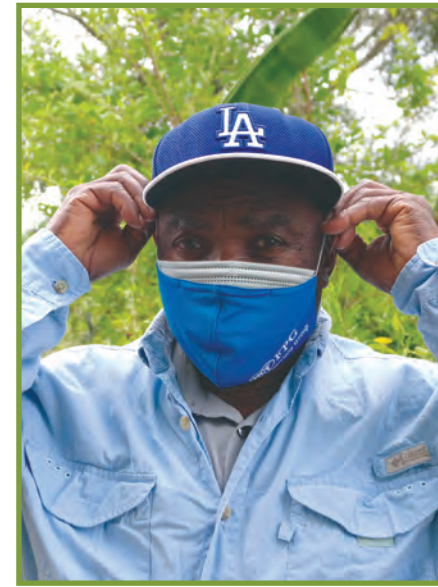
Mete mas la se yon fason pou pwoteje fanmi w ak kominote w. Pa janm bliye mete l.