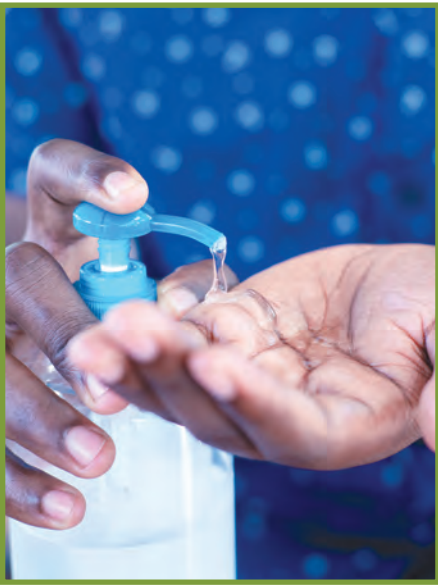
Netwaye men w avèk yon dezenfektan (hand sanitizer) lè savon ak dlo pa disponib.